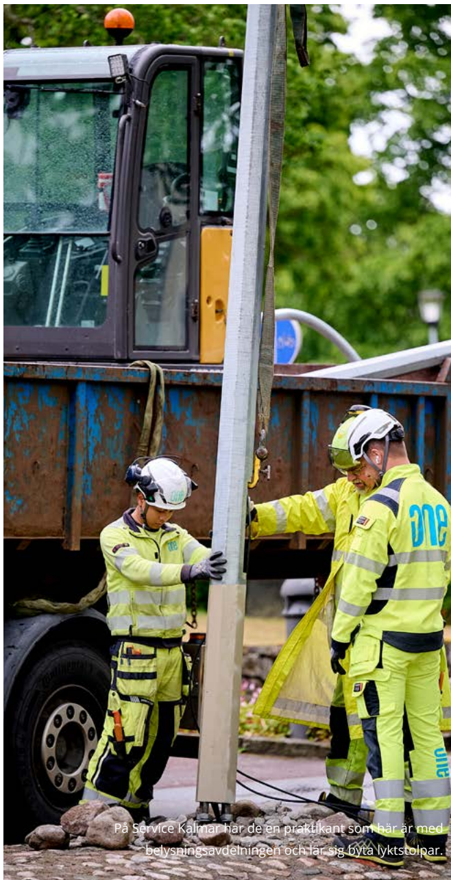
På Service Kalmar har de en praktikant som här är med belysningsavdelningen och får sig byta lyktstolpar.

Vi bygger vår verksamhet på hållbara affärsmetoder och följer de internationella principerna i FN:s Global Compact – krav som vi även ställer på våra underentreprenörer och transportörer. Genom att kombinera teknisk kompetens med hållbarhetsansvar bidrar vi med innovativa lösningar till ett energisystem som är redo för framtiden.