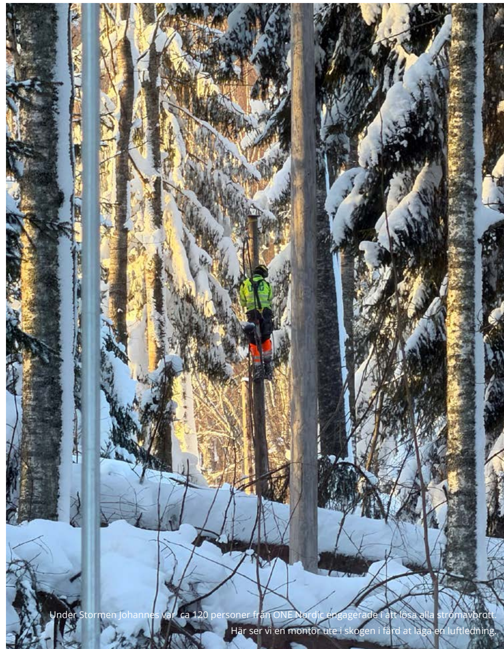
Under Stormen Johannes var ca 120 personer från ONE Nordic engagerade i att lösa alla strömavbrott. Här ser vi en montör ute i skogen i färd att laga en luftledning.

Extrema väderhändelser blir vanligare i takt med klimatförändringarna. Klimatmodeller visar att sådana händelser är en återkommande risk för infrastrukturen i norra Europa. Detta är något som vi på ONE Nordic behöver ta höjd för i vår framtida planering när det gäller utbildning, rekrytering och resursplanering.