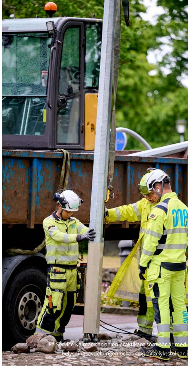
På Service Kalmar har de en praktikant som här är med belysningsavdelningen och får sig byta lyktstolpar.

Vi bygger vår verksamhet på hållbara affärsmetoder och följer de internationella principerna i FN:s Global Compact – krav som vi även ställer på våra underentreprenörer och transportörer. Genom att kombinera teknisk kompetens med hållbarhetsansvar bidrar vi med innovativa lösningar till ett energisystem som är redo för framtiden.