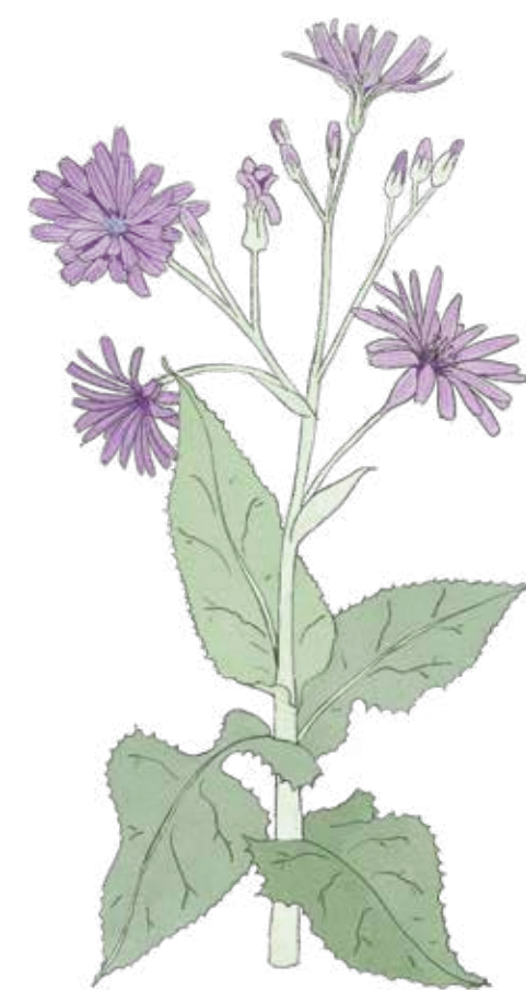
Parksallat Lactuca macrophylla