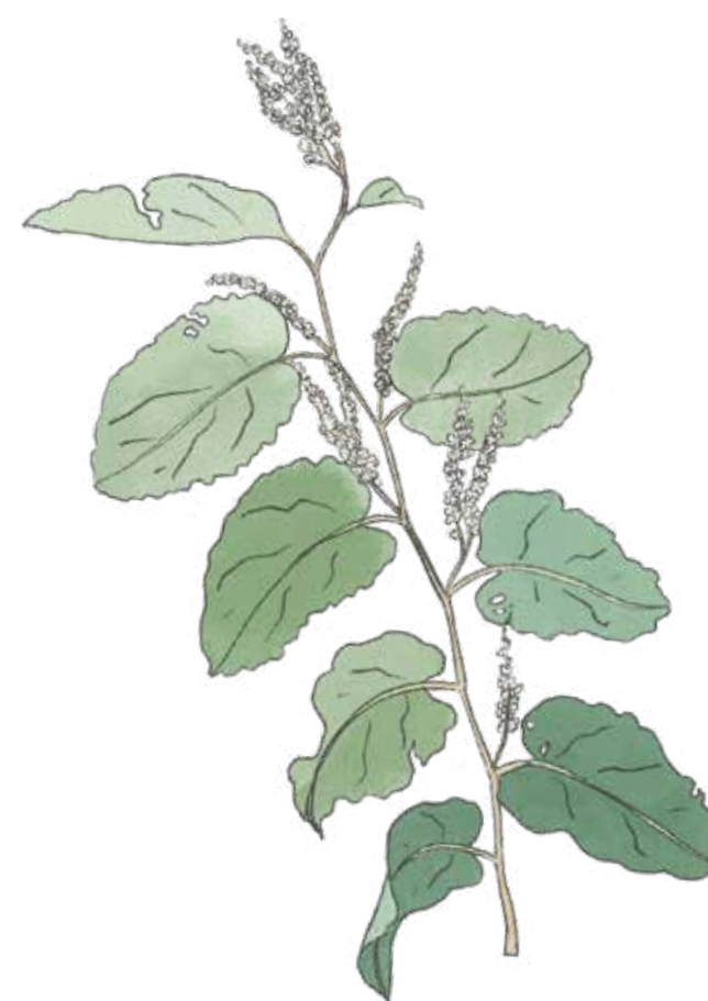
Jätteslide Reynoutria sachalinensis