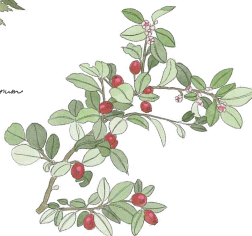
Spärroxbär Coloneaster divaricatus