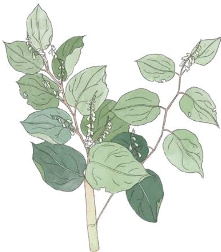
Parkslide Reynoutria japonica