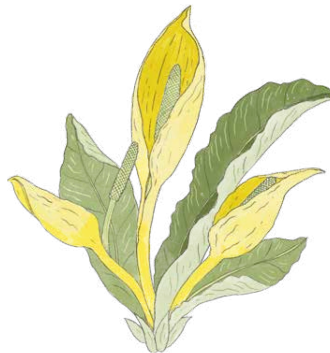
Gul skunkkalla Lysichiton americanus