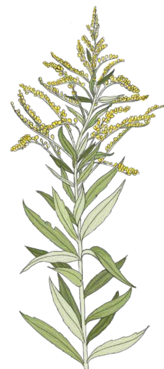
Kanadensiskt gullris Solidago canadensis

Vi på ONE Nordic bygger, planerar och utformar framtidens hållbara energisamhälle tillsammans med våra kunder. Vårt arbete inbegriper mycket markarbeten där vi kommer i kontakt med bland annat invasiva växter. Den biologiska mångfalden och våra ekosystem behöver skyddas och arbetet med att förhindra samt minska spridning av invasiva växter är viktigt för ONE Nordic. Med respekt för vår omgivning ser vi till att energin når befolkningen och industrin, nu och i framtiden.