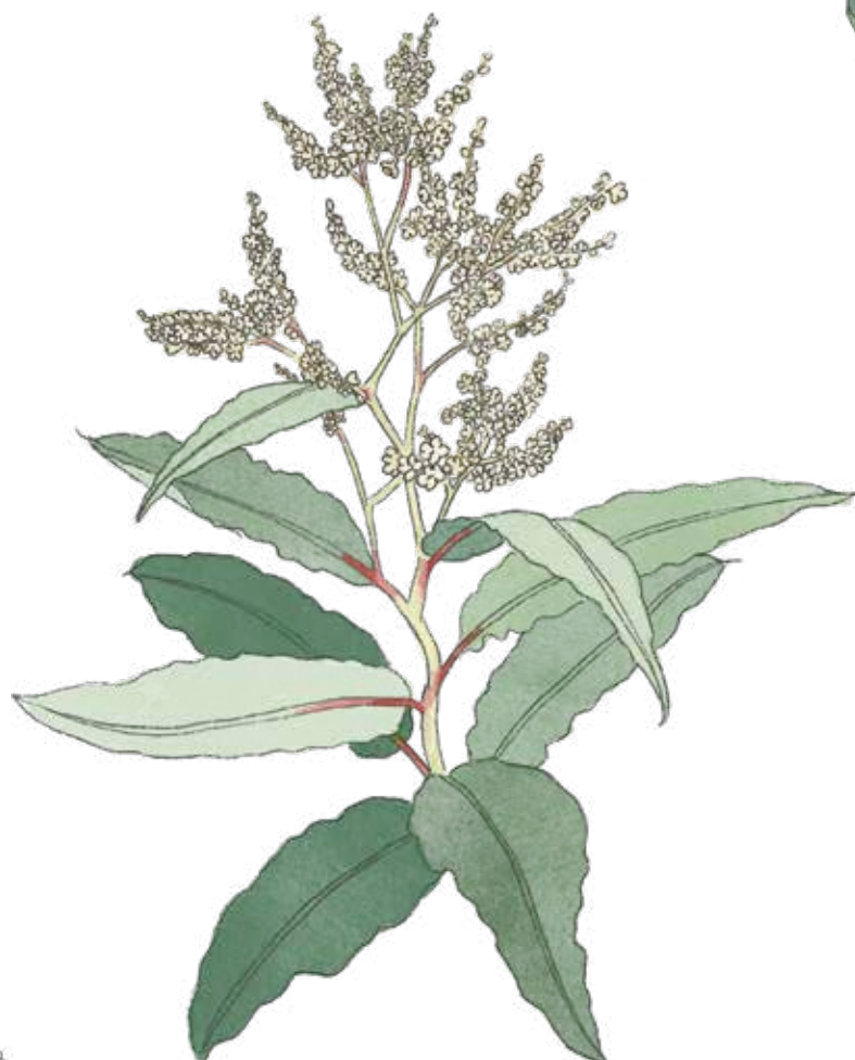
Syrenslide Rubrivina polystachya