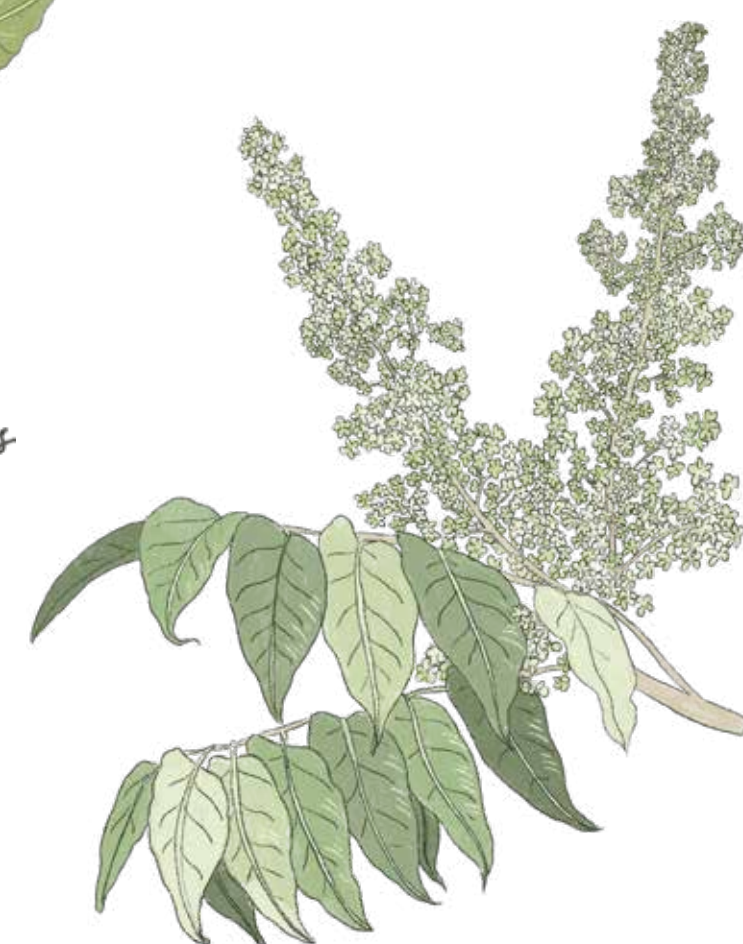
Gudaträd Ailanthus altissima