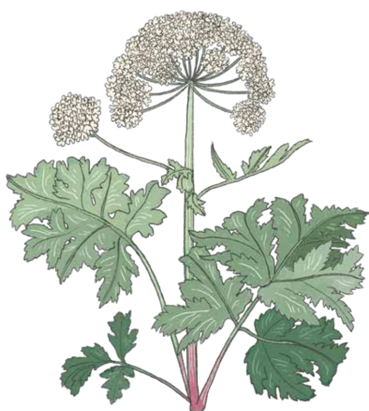
Tromsöloka Heracleum persicum