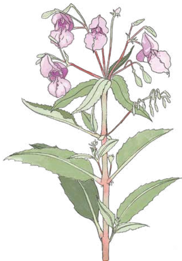
Jättebalsamin Impatiens glandulifera