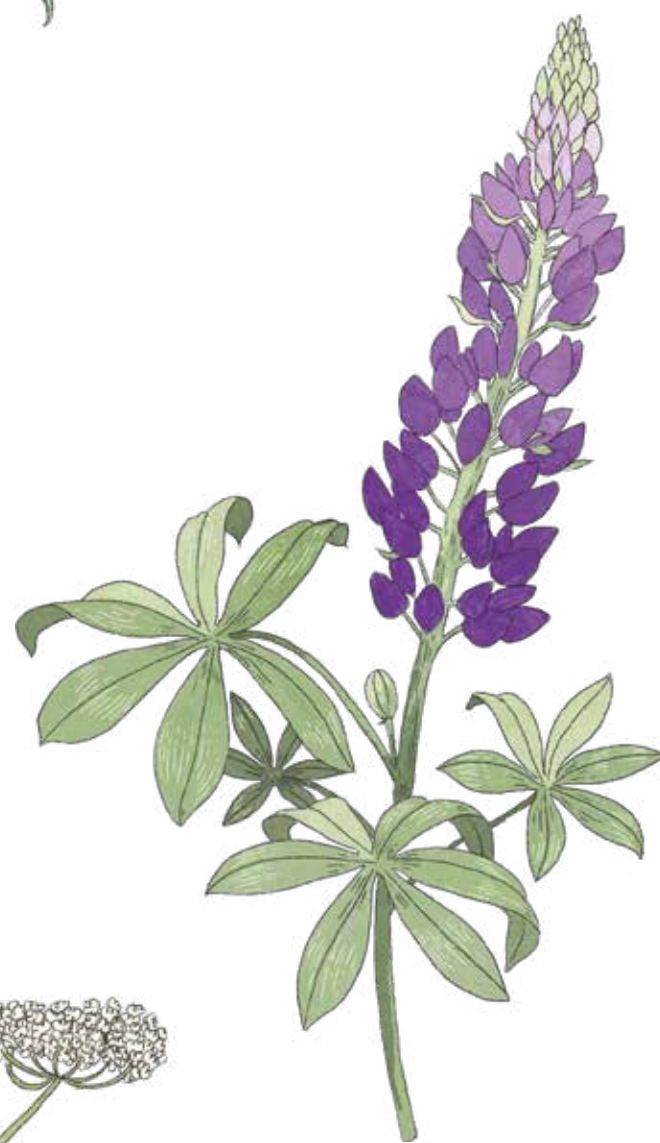
Blomsterlupin Lupinus polyphyllus