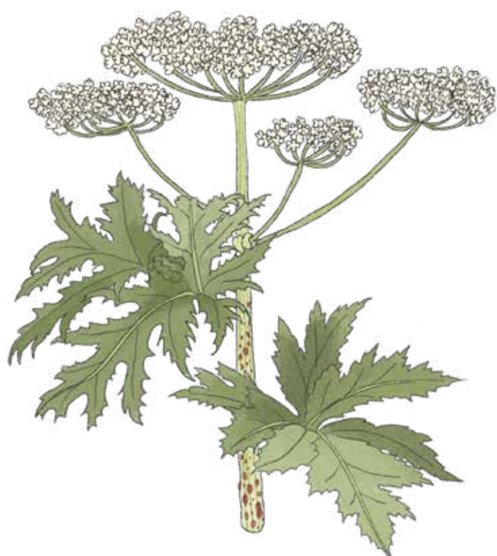
Jätteleka Heracleum mantegazzianum